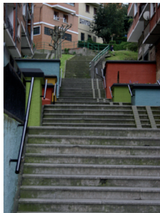
Escaleras mecánicas de Larrea.

EAJ-PNV no pretende realizar obras faraónicas sino que debemos tener pies en la tierra e intentar cubrir las necesidades de los vecinos. Para ello hay que establecer prioridades e intentar llegar a todos los puntos y rincones de nuestro pueblo.