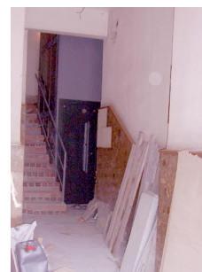
Ayudas para instalación ascensores y accesibilidad a los portales.