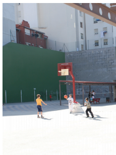
Kirol eta kultur gune berriak Margarigan.

Erdialdeko parkean, 700m karratuko umeentzako joku berriak. Urte bakoitzeko ume parke bateko konprometua.