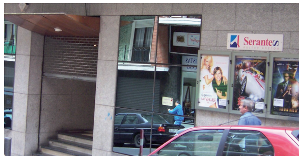
Remodelación del SKA.