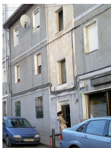
Definición del futuro del barrio del Bullón. Un modelo de participación ciudadana.