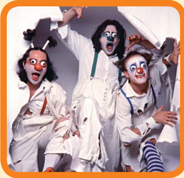
Compañía Mimirichi (Rusia). 3 €