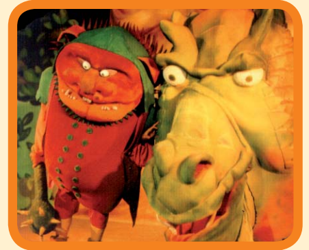
Teatro Mutis. 3 €