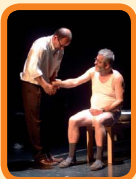
Hika Antzerki Taldea. 6 €

Urriak 23 Octubre AITAREKIN BIDAIA Euskaraz.