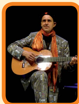
Ez Dok Hiru Biko Teatro. 6 €

Urriak 24 Octubre EUSKARAZETAMOL Euskaraz.