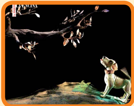
Compañía La Maquiné. 3 €