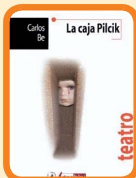
Mosaico Mercurio. 10 € Premio Teatro Serantes 08.

Azaroak 13 Noviembre LA CAJA PILCIK Estreno absoluto.