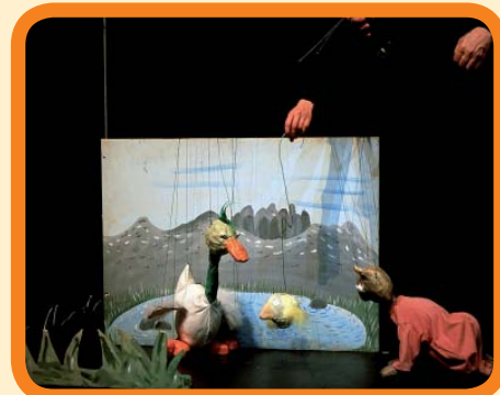
Per Poc konpainia. 3 €