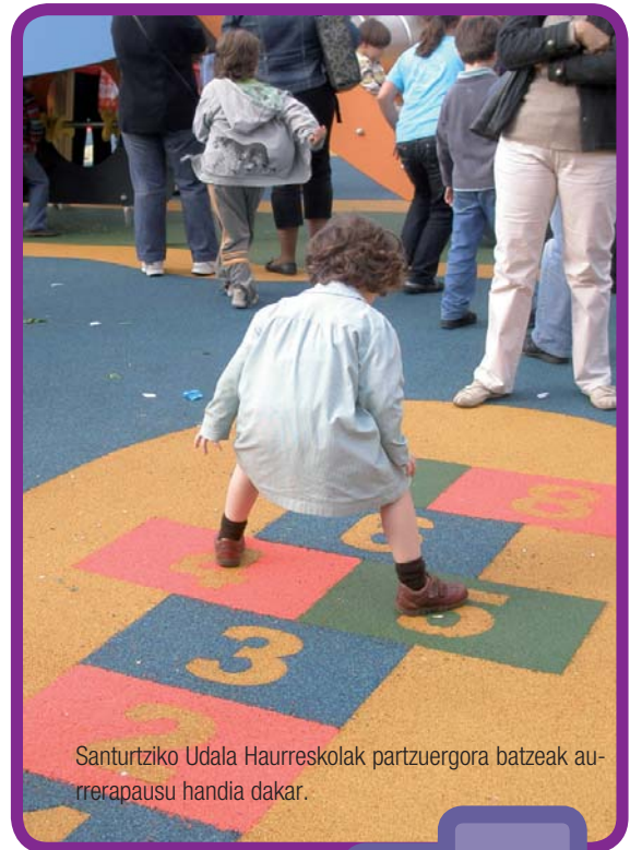
Santurtziko Udala Haurreskolak partzuegora batzuek aurrerapausu handia dakar.