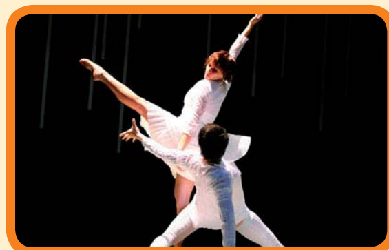
Quasar & Cia de danza. 15 €

Urriak 30 Octubre SÓ TINHA SER COM VOCÉ Estreno en Euskadi. Danza.