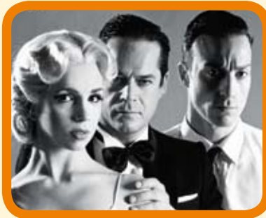
Apirilak 29 Abril - 20:30 h. CRIMEN PERFECTO 15 € - Iraupena/Duración: 120 min.