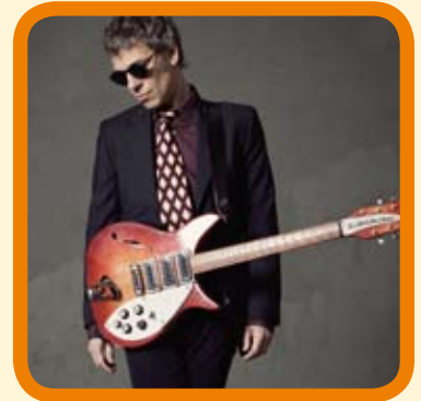
Apirilak 15 Abril - 20:30 h. Concierto ARIEL ROT 12 €

Antzerkia, musika, opera, haurrentzako ikuskizunak... eritmo geldiezia darama Serantes Kultur Aretoak eta gure zorionerako hemen bertan disfrutatu dezakegu, Santurtzin. Anima zaitetz!