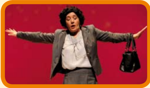
Apirilak 1 Abril - 20:30 h. TENGAMOS EL SEXO EN PAZ 10 € - Iraupena/Duración: 60 min.

Antzerkia, musika, opera, haurrentzako ikuskizunak... eritmo geldiezia darama Serantes Kultur Aretoak eta gure zorionerako hemen bertan disfrutatu dezakegu, Santurtzin. Anima zaitetz!