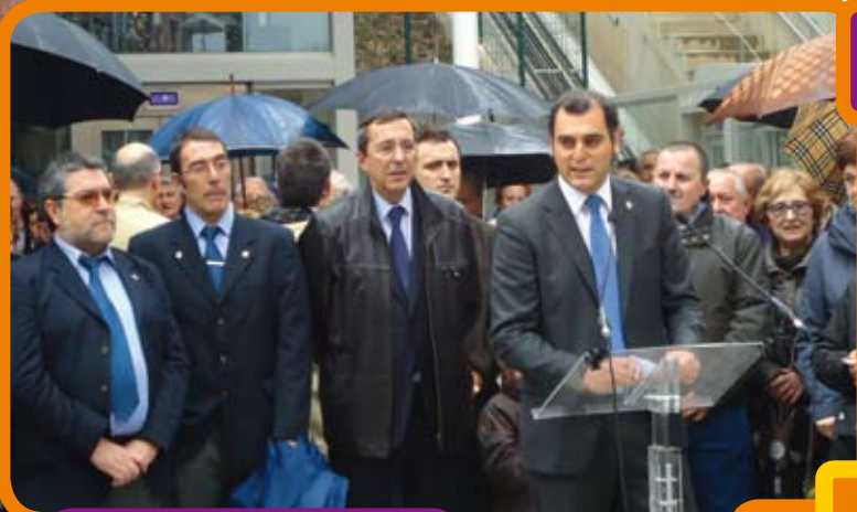
Santurtzi ha saldado una deuda pendiente con las personas de la zona de Larrea y sus alrededores.