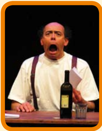
Maiatzak 6 Mayo - 20:30 h. LA CARTA 12 € - Iraupena/Duración: 70 min.