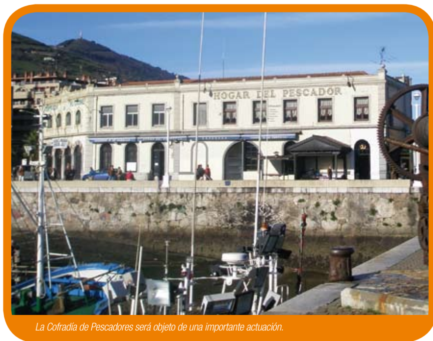
La Cofradía de Pescadores será objeto de una importante actuación.

En total, Santurtzi tendrá unos presupuestos de 68,8 millones de euros, que apuestan por reducir el gasto corriente, fruto de la actual situación de crisis, y por un especial esfuerzo para reforzar materias sociales. Así, la partida para Ayudas de Emergencia Social se verá incrementada en un 25% y la del Servicio de Ayuda Domiciliaria, un 15,61%.