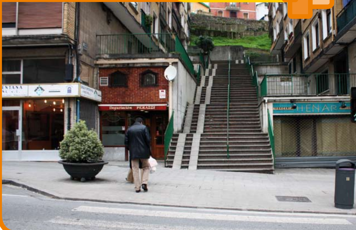
El Grupo Lapurdi saldrá ganando gracias a un nuevo ascensor

2010.erako aurrekontuak, datorren hilean ontzat emango direnak, gizartearen onura hartzen dute aintzat. Horrela, krisialdia bitarte, gastu arruntak murriztuko dira eta arlo soziala bultzatzeko ahalegina burutuko da. Gainera, datorren urterako aurreikusitako inbertsioak direla medio, gure herriko kaleak, eta ondorioz, Santurtziarren bizi-kalitatea hobetuko dira.