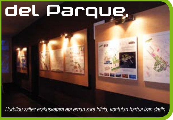
Hurbildu zaitez erakusketara eta eman zure iritzia, kontutan hartua izan dadin

De esta manera, podrás observar uno a uno los proyectos, diferenciados por colores, y votar en las urnas que se encuentran en la exposición el color correspondiente al que más te ha gustado. Como verás, cada idea destaca matices diferentes, como espacios libres, más zonas verdes, lugares de juegos... ¿Cuál es el que más te gusta? Ven y cuéntanoslo, porque la votación popular contará a la hora de elegir qué proyecto se va a desarrollar. Llevando a la práctica esta idea, los y las santurtziarras ganaremos en espacio, en ocio y en calidad de vida y por supuesto, nos acercaremos a la mar.