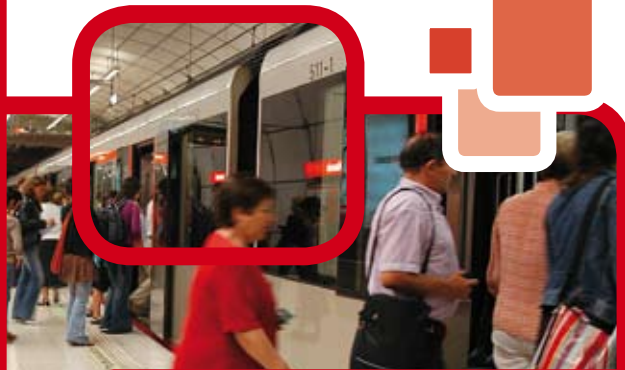
La gente de Kabeizes también se subirá al Metro.