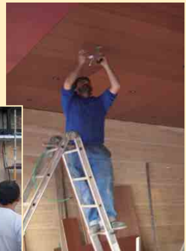
Los operarios trabajaron a destajo los días previos al comienzo del festival y es que ya se sabe que... The show must go on!

Se han realizado las siguientes obras en la entrada: ampliación de la taquilla, cambio del revestimiento de suelo y paredes, construcción de rampa fija para minusválidos, colocación de nuevas puertas de acceso, alumbrado e instalación en pared de rótulo con el nombre del teatro, además de pantallas de plasma para las carteleras anunciadoras tanto de teatro como de cine.