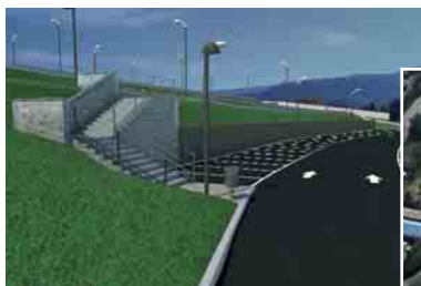
Fotomontaje: futuros aparcamientos de San Juan